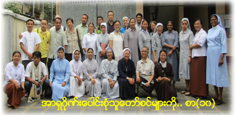
အာရှဂိုဏ်းပေါင်းစုံသူတော်စင်များကို.. စာ(၁၀)