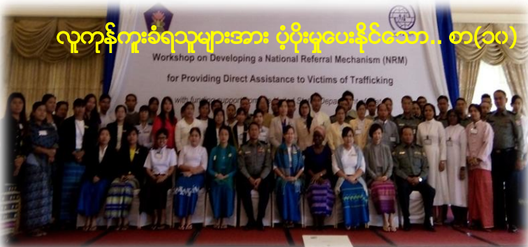
လူကုန်ကူးခံရသူများအား ပံ့ပိုးမှုပေးနိုင်သော... စာ(၁၀)

Workshop on Developing a National Referral Mechanism (NRM) for Providing Direct Assistance to Victims of Trafficking