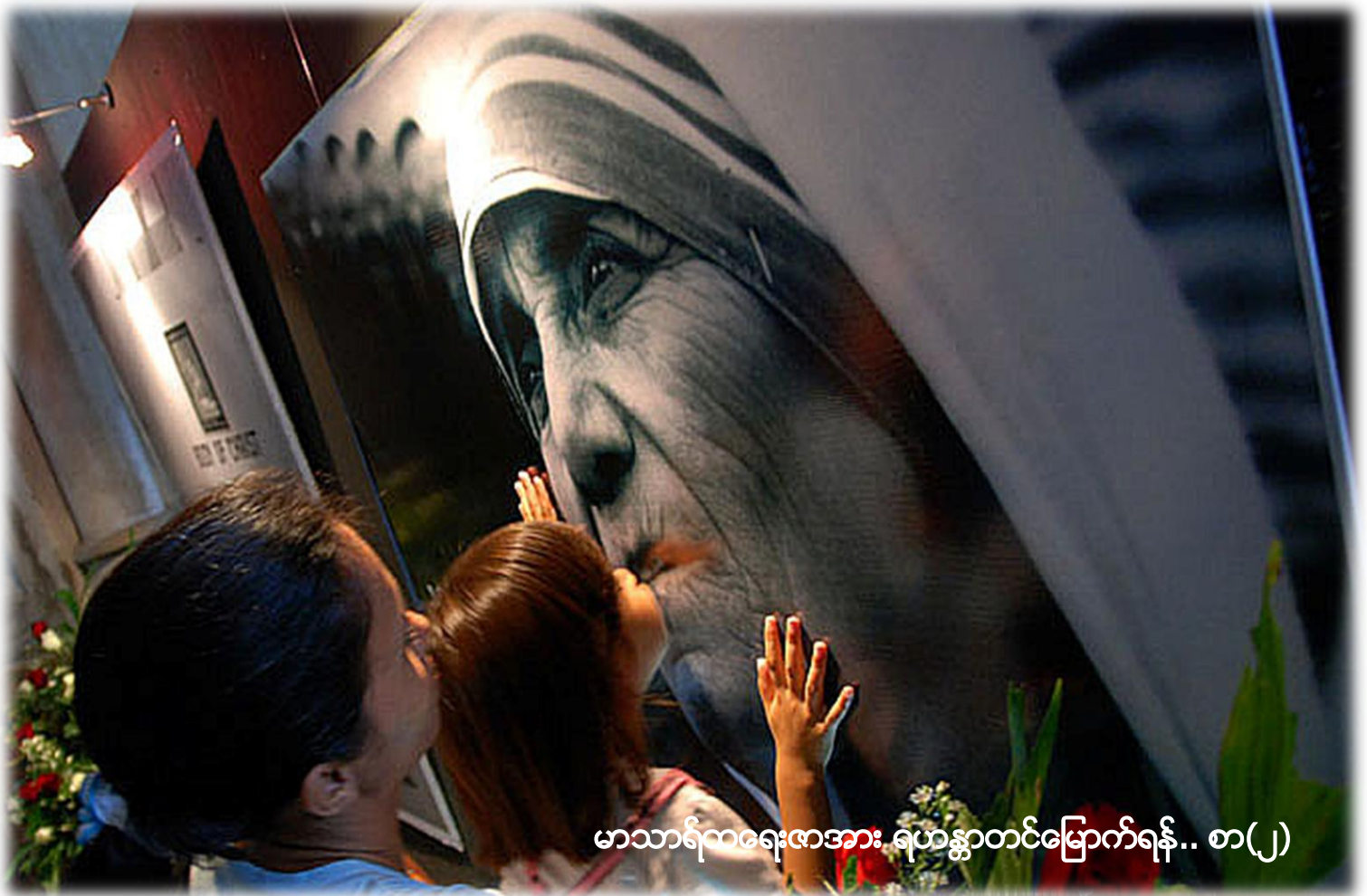
မာသာရီထရေးဇာအား ရဟန္တာတင်မြောက်ရန်.. စာ(၂)