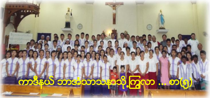
ကာဒီနယ် ဘာဒေါသာသနာသို့ကြွလာ ... စာ(၅)