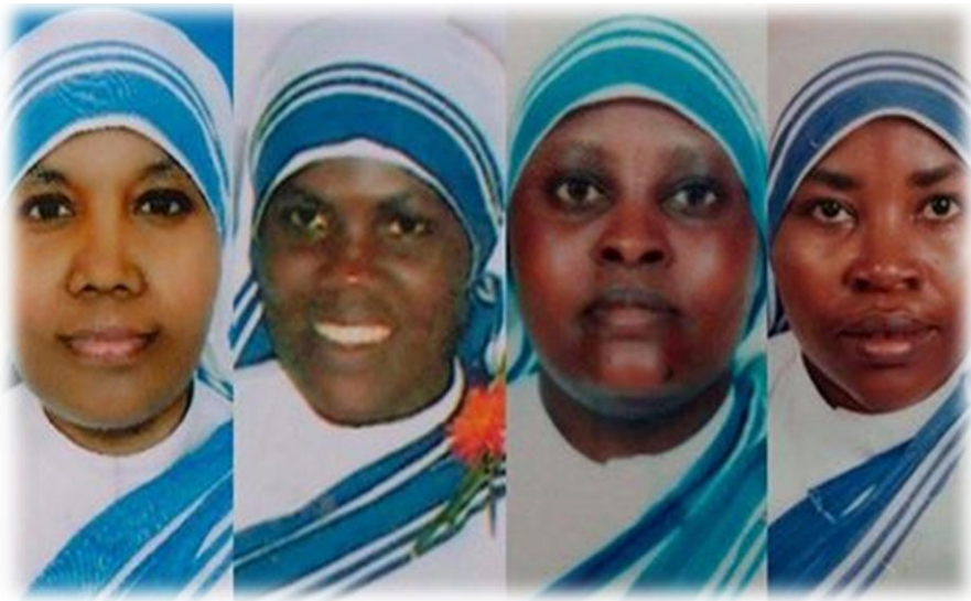
ယီမင်နိုင်ငံ၌ မာသာရီထရေးဇာ၏သီလရှင်(၄)ပါး....စာ (၂)