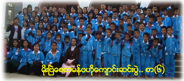
မိုးပြစေတီမန်ဗဟိုကျောင်းဆင်းပွဲ.. စာ(၆)