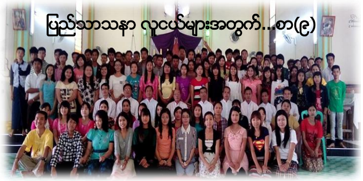
ပြည်သာသနာ လူငယ်များအတွက်...စာ(၉)

Workshop on Developing a National Referral Mechanism (NRM) for Providing Direct Assistance to Victims of Trafficking