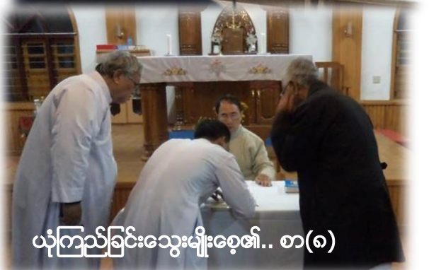
ယုံကြည်ခြင်းသွေးမျိုးစေ့၏.. စာ(၈)