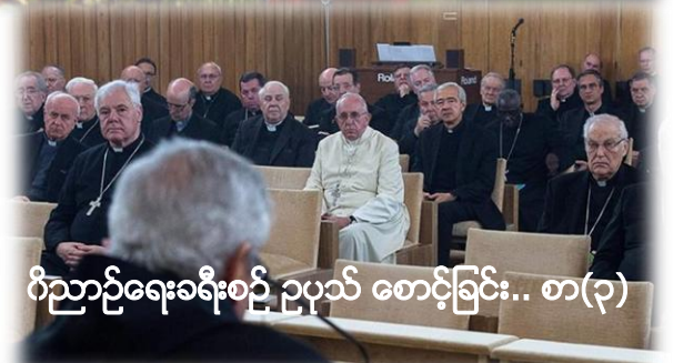
ဂီညာဉ်ရေးခရီးစဉ် ဥပုသ် စောင့်ခြင်း.. စာ(၃)