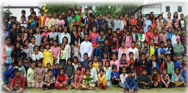
မျိုးဆက်သစ်လူငယ်တို့၏ခြေလှမ်းများ...စာ(၉)