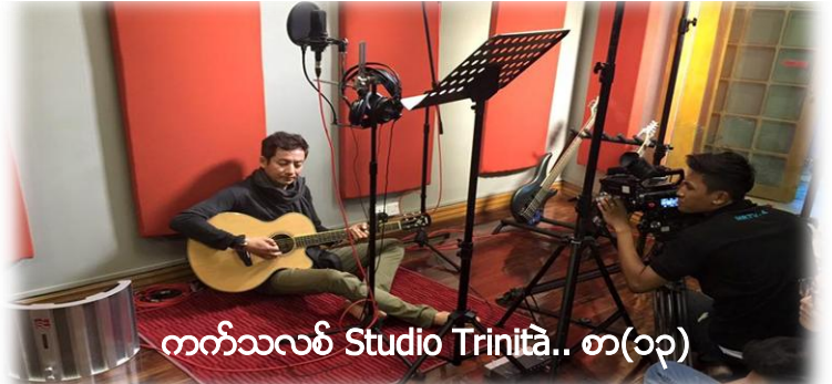
ကက်သလပ် Studio Trinita.. စာ(၁၃)