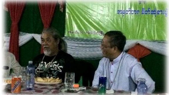
စာပေဟောပြောပွဲ...စာ(၇)