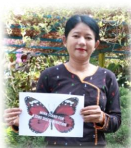
ခွဲခြားနှိမ့်ချဆက် ...စာ(၁၁)