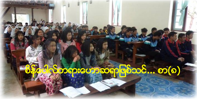
စိန်ခေါင်စာရားဟောဆရာဖြစ်သင်... စာ(၈)